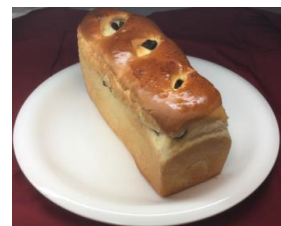
レーズンたっぷり 230円

一番人気商品のレーズンパン、朝食にピッタリ軽い口当たりの山型食パンもさらに美味しくなりました。