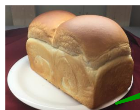
隠れた人気商品 290円